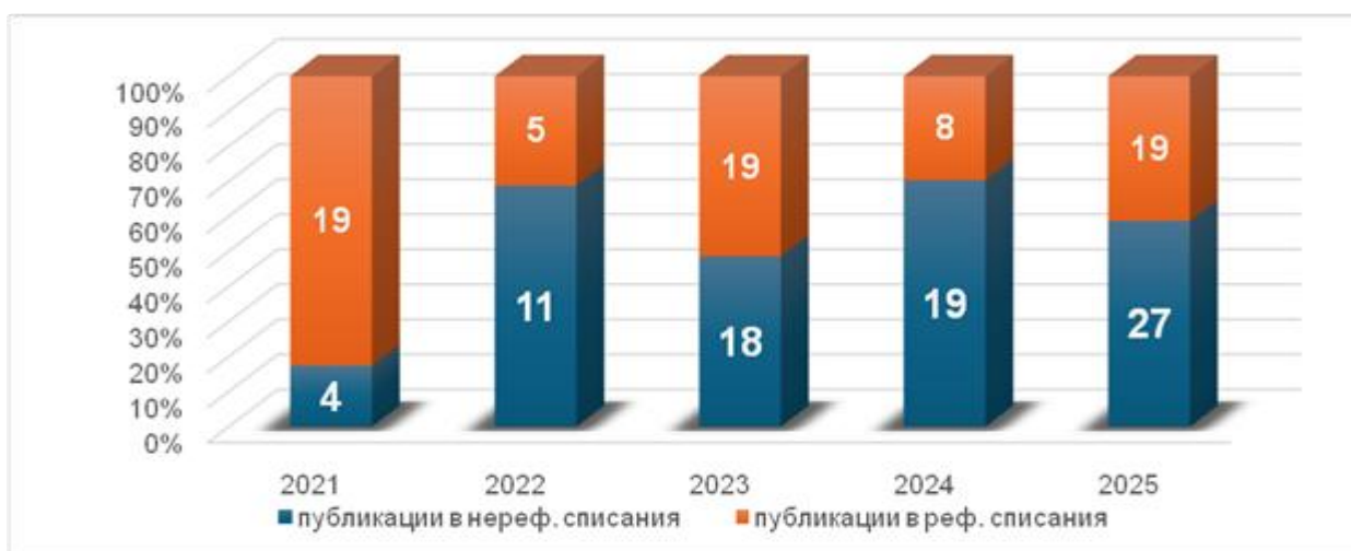
Фиг. 2 Публикации на научния колектив през периода 2021-2025 г

Броят на цитиранията на научни публикации на академичния състав, за периода 2021-2025 г.е 241, от тях 135 са в списания и сборници с доклади от конференции, индексирани във Web of Science (All databases) и/или Scopus и 106 в чуждестранни и български списания с научно рецензиране (Табл. 4, Фиг. 2).